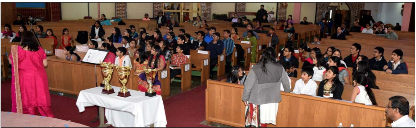
Bible Quiz of Senior Team.