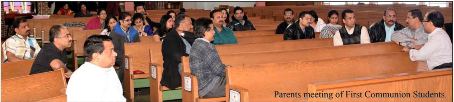
Parents meeting of First Communion Students.