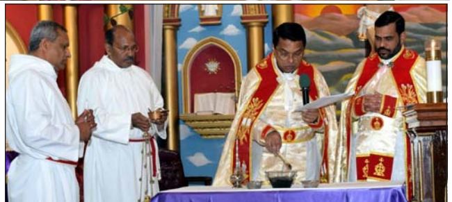
Blessing of Ashes on Ash Monday