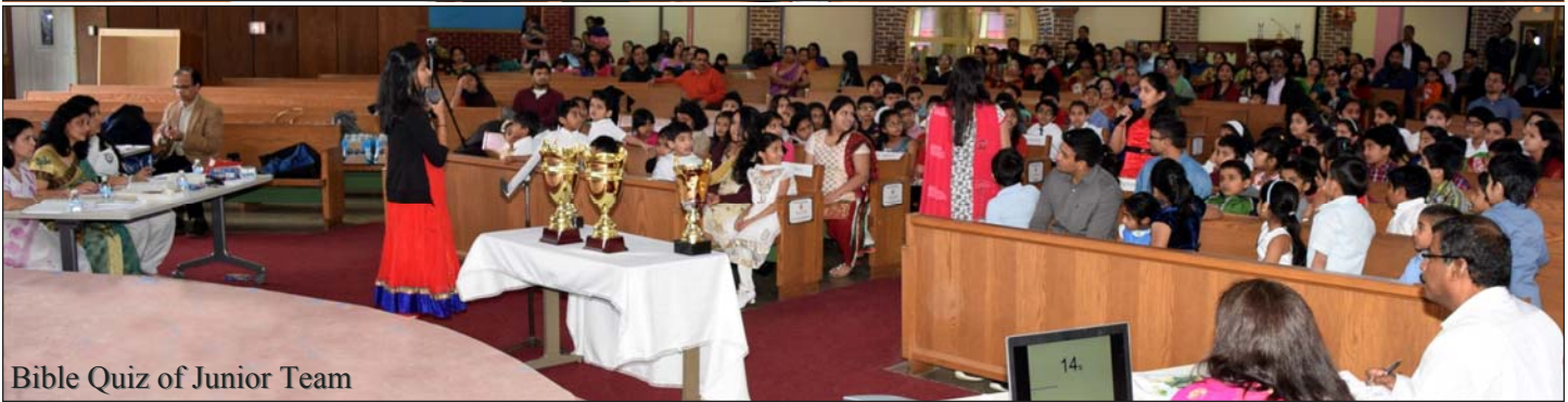
Bible Quiz of Junior Team