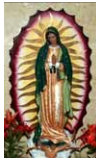
- Alamma Nellamattam