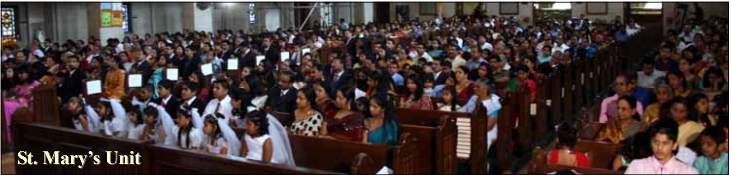
St. Mary's Unit