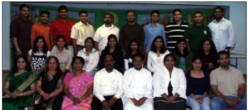
Pre-Marriage Course held at our Church in Maywood.