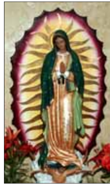
- Shija Jose

Please pay your dues of 2008 before we publish the list.