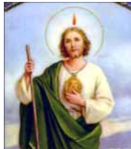
- ഒരു വിശ്വാസി