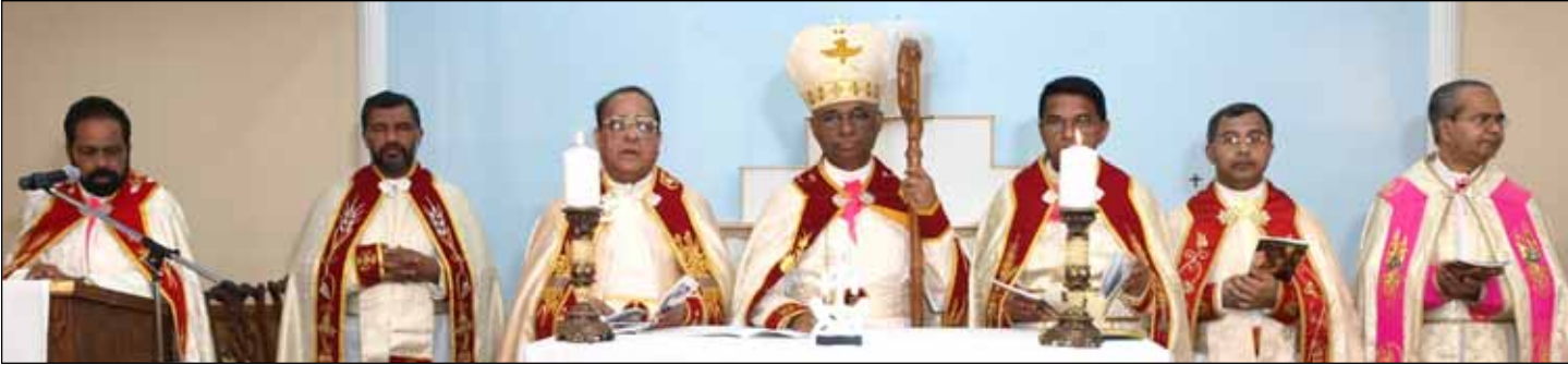
Blessing of Holy Family Church in Atlanta and declaration of the Holy Family Knanaya Catholic Parish in Atlanta.