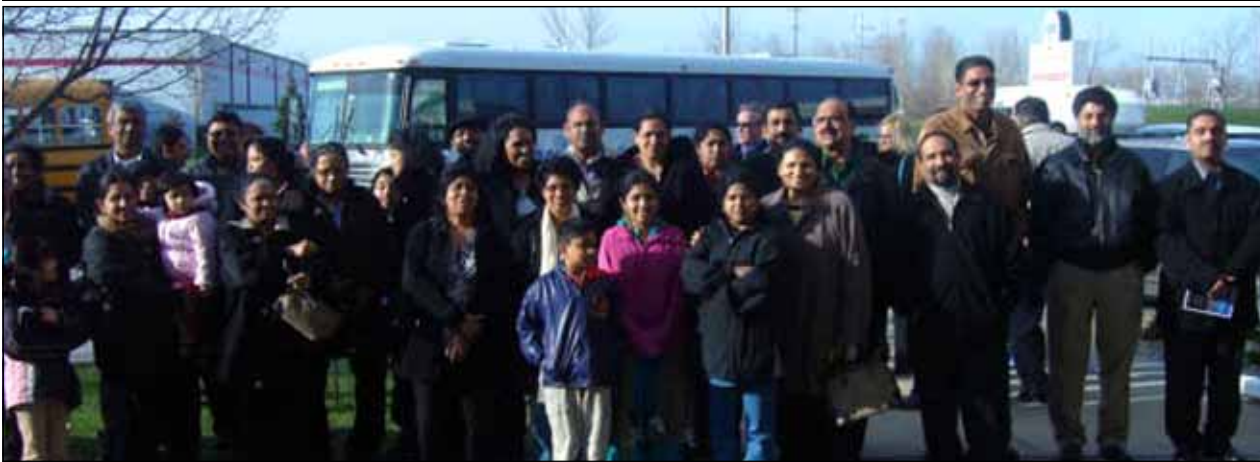
Photo left: A few from our parish who attended the live passion play, Jesus of Nazareth held at Munster, Indiana.