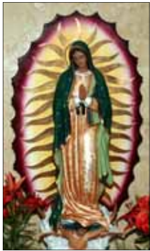
- Madayanakavil Family