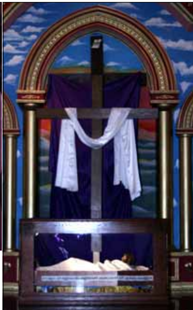
Scenes from the Good Friday Service held at our church. More photos of the Holy Week Services of Sacred Heart Church and St. Mary's Unit inside this issue and in the next issue.