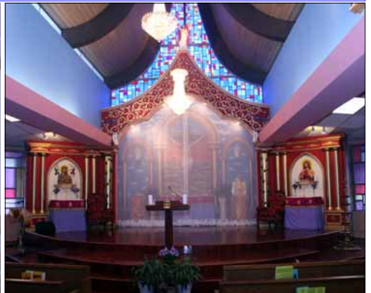
The sanctuary of our church with newly installed curtain according to the tradition of the Eastern churches.