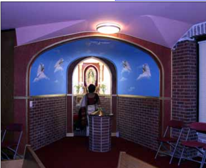
The shrine of Our Lady of Guadalupe and Baptismal font in our church with the statue brought from Guadalupe.