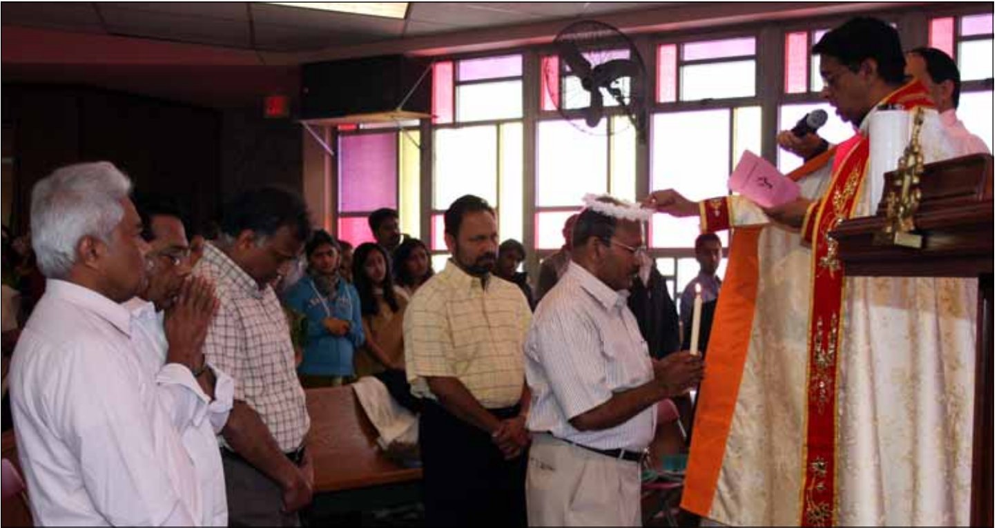
For Favors Received