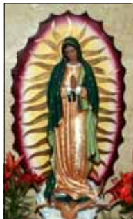
- ഒരു വിശ്വാസി