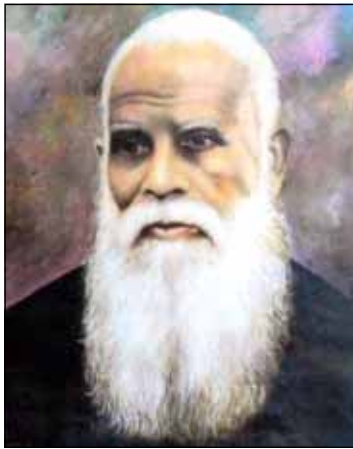
ദൈവ ദാസൻ പുതത്തിൽ തൊമ്മിയച്ചൻ

"ആണ്ടോ തൊമ്മിയച്ചൻ വരുന്നു." പിന്നെ സ്മശാന മൃകത. ഏതാണ്ട് 68 വർഷങ്ങൾക്കു മുൻപ് കൈപ്പഴ പള്ളിയിൽ ഒരു ഞായറാഴ്ച കർബ്ബാന സമയത്ത് കുട്ടികൾ ത്രോണോസിന്റെ തൊട്ടടുത്തായി മുട്ടുകുത്തിയും ചന്ദ്രം പടഞ്ഞും ഇരിക്കുകയായിരുന്നു. കർബ്ബാനയ്ക്കു മിക്കവരും നേരത്തെ പള്ളിയിൽ വരുന്നതിനാൽ വിരുതന്മാരായ കുട്ടികളിൽ ചിലർ മുൻപിലിരിക്കുന്ന സൽസ്വഭാവിയായ ഏതെങ്കിലും കുട്ടിയുടെ ചെവിയ്ക്കിൽ തോണ്ടും. അപ്പോൾ തോണ്ടു കിട്ടിയവൻ പിന്തിരിഞ്ഞു നോക്കുമ്പോൾ കുറുവാളി ഒന്നാമറിയത്താൽ ഇരിക്കും. തന്നെ തോണ്ടിയവനെ നന്നെ തെറ്റിദ്ധരിച്ച് വെറുതെയിരുന്ന മറ്റൊരു കുട്ടിയുടെ തലയ്ക്ക് തോണ്ടു കിട്ടിയവൻ ശക്തിയോടൊരു തോണ്ടുകൊടുക്കും. നിരപരാധിയായ അവൻ അപ്പോൾ തന്നെ തോണ്ടിയവനെ കൂടുതൽ ശക്തിയോടെ തിരിച്ചു തോണ്ടും. അപ്പോൾ വിരുതന്മാരും മറ്റു കാണികളും ചിരിക്കും. കുട്ടി പിശാചിന്റെ പ്രേരണയാൽ ഇങ്ങനെ നെയ്യുള്ള കളികൾ അങ്ങിങ്ങു അരങ്ങേറുന്നുണ്ടായിരുന്നു.