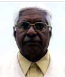
തയ്യാറാക്കിയത്: ഓ.ജെ. ജോൺ ക്ലാക്കിയിൽ

ഈ അവസരത്തിലാണ് ഇടവക പള്ളിയിൽ വിശ്രമ ജീവിതത്തിനായി എത്തിയിട്ടുള്ള ബഹു. പുതത്തിൽ തൊമ്മിയച്ചൻ കർബ്ബാന ചൊല്ലുവാനായി കയറി വരുന്നത്. അപ്പോൾ ഏറ്റവും പിറകിലുള്ള കുട്ടി അധികം ശബ്ദമുണ്ടാക്കാതെ പറയും: "ആണ്ടോ തൊമ്മിയച്ചൻ വരുന്നു." അതോടെ അവിടെ ശ്മശാന മൃകതയായും. അച്ചൻ നോക്കുമ്പോൾ