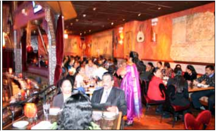
Christmas and New Year Celebration of Men's and Women's Ministry at Alhambra Palace Restaurant in Chicago