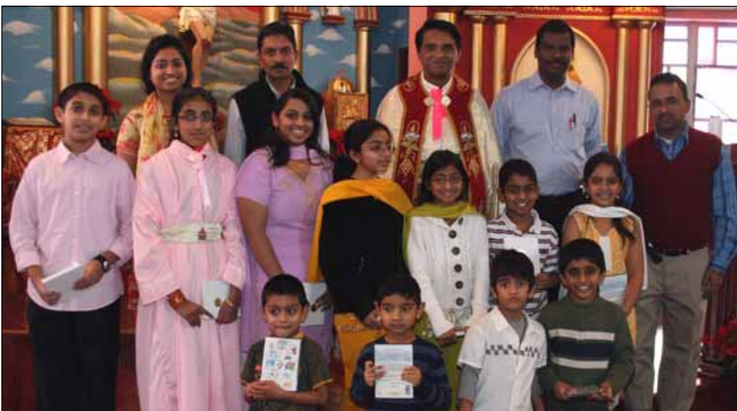
Students of the Month in December 2008 with Religious Education leaders.