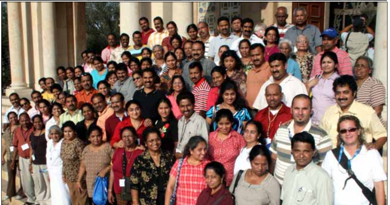
Photo Right: In front of the Church of Gethsemane where Jesus prayed before his arrest there.