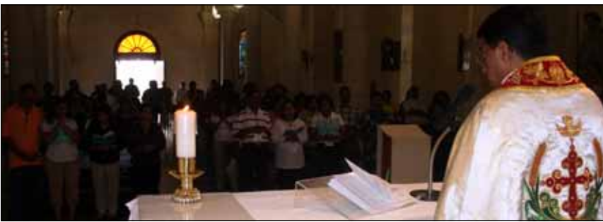
Photos Below: Mass at the Holy Family Chapel in Nazareth. Renewal of Baptismal promises at River Jordan.