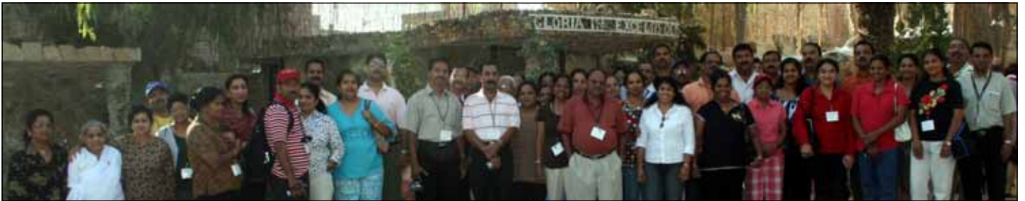
Photo Above: At Shepherds' Field in Bethlehem where angels appeared to the shepherds to announce the birth of Jesus.