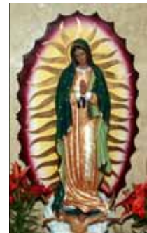
- തോമസ് & മേരി ആലുങ്കൽ