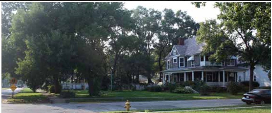
Photo Right: Property across Maple Street from our church that we have purchased for our Youth Center Project. Dedication of the property will be on October 26th after the Holy Mass at 10:00 A.M.

Photo Above: Pilgrims from our parish in front of St. Peter's Basilica after the canonization of St. Alphonsa.