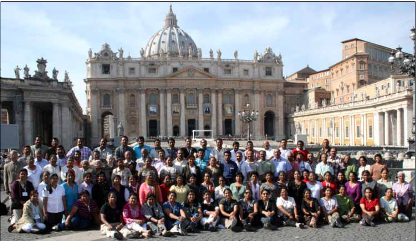
Photo Above: Pilgrims from our parish in front of St. Peter's Basilica after the canonization of St. Alphonsa.

Photo Right: Property across Maple Street from our church that we have purchased for our Youth Center Project. Dedication of the property will be on October 26th after the Holy Mass at 10:00 A.M.