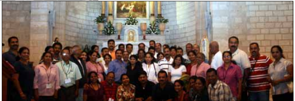
Photo Right: Photo after renewal of Marriage promise at the Chapel of Cana where Jesus did his first miracle by changing water to wine.