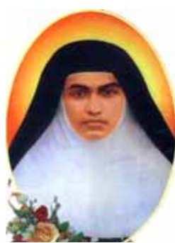
- ഓ.ജെ. ജോൺ ക്ലാക്കിയിൽ