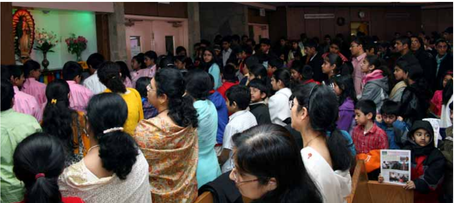
Photo above: Religious Education students and teachers praying at the statue of Our Lady of Guadalupe in our church after Syro-Malabar Holy Mass in English.