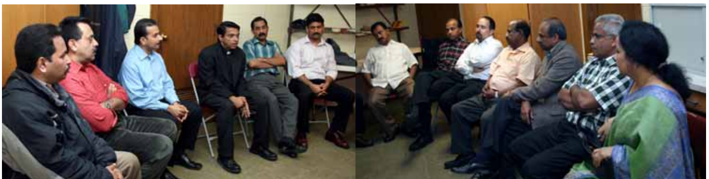
Photo below: Discussion on the annual feast of the Most Sacred Heart of Jesus to be held in our church from May 23 to 25th.